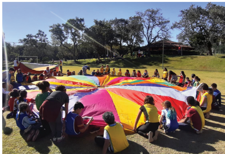
Acima, acantonamento de Férias de 2019. Abaixo, melhorias na Chácara Bauru.